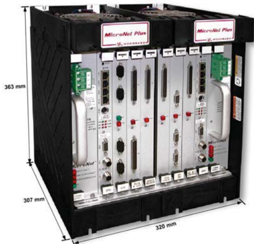
Шасси MicroNet Plus (8 слотов VME)

Источники питания могут быть одиночными или резервированными в любой комбинации входных напряжений.