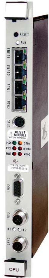
MicroNet Plus CPU5200

Система MicroNet Plus для повышения надежности может работать в режиме мастера и резервного устройства в режиме ожидания. Синхронизированная память гарантирует идентичность рабочей информации в каждой из групп процессоров. Если ведущий процессор (мастер) перестает работать корректно, полное управление системой, включая управление входами-выходами, передается резервному процессору менее чем за 1мс без влияния на работу главного двигателя. После устранения неисправности главного процессора, система может остаться в работе на резервном процессоре или передать управление обратно главному. Оповещение о передаче управления передается посредством линий связи