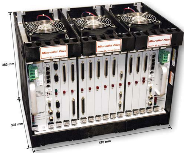
Шасси MicroNet Plus (14 слотов VME)